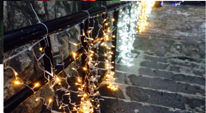
소원의 방울달기 낙산공원 트리 장식