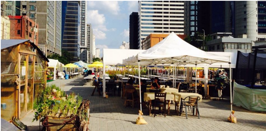
목공,안마,문화공연 워크샵 유치