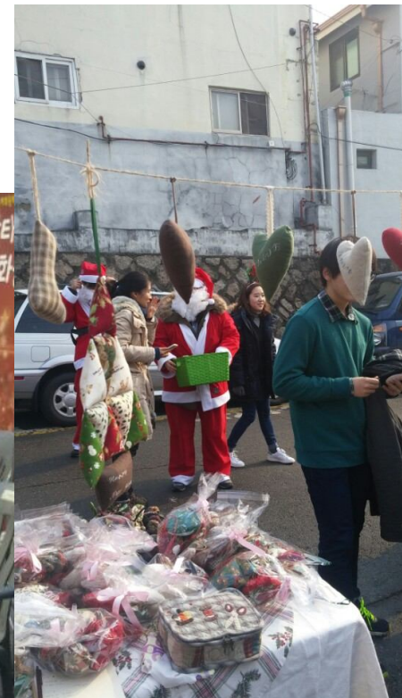
마을기업 상품 판매 문화공연